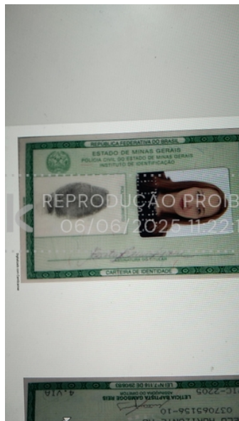
Foto da frente do documento oficial com hash SHA256 prefixo d43ee8(...)

official_document_front_06 jun 2025, 11-22-16.jpeg